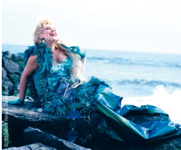
Dianne Brill posiert am Long Beach für «Rolling Stone» (1985). Dianne Brill poses for Rolling Stone on Long Beach (1985).