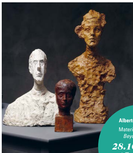
Kunsthaus Zürich, © Alberto Giacometti-Stiftung. Grand buste de Diego d'après nature 1951, Kopf Diego 1914, Annéto VI 1962.